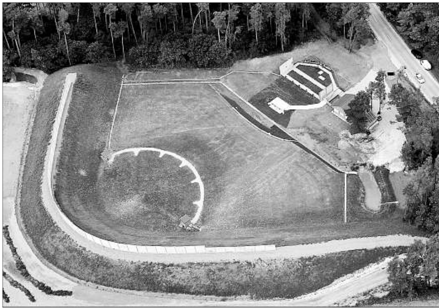
Reichlich Munition wurde in der vor drei Monaten eröffneten umweltverträglichen Trap- und Skeet-Schießanlage bei Brunnen schon versossen. Die Anlage gilt bayernweit als Vorzeigeprojekt.

Ein Hopfenmahl bietet der Ring junger Hopfenpflanzer allen Interessierten an diesem Sonntag an. Los geht es um 11.30 Uhr im Gasthaus Reich in Niederlauerbach bei Wolnzach. Die Veranstaltung wird wieder musikalisch umrahmt vom Holledauer Dreispänn mit humorvollem und geselligem Programm rund um den Hopfen. Tischreservierungen sind möglich beim Gasthaus Reich unter Telefon (0 84 42) 39 37.