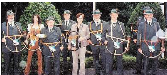
Mit seinen seltenen Hörnern wird das Bläserkorps Horrido Attendorf zum Jubiläum des Frauenchors anreisen.

Als Jagdhorn wurde der Halbmond durch das heute gebräuchliche Fürst-Pless-Hörn abgelöst. Bei Horrido wird der heute fast unbekannte Halbmond aus Tradition geblasen.